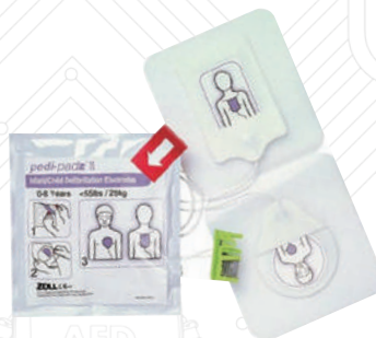
兒童專用貼片 適當的電擊電量大小 (50J-70J)