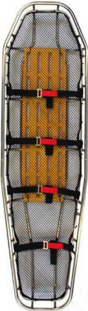
錐形不銹鋼 錐形鈦