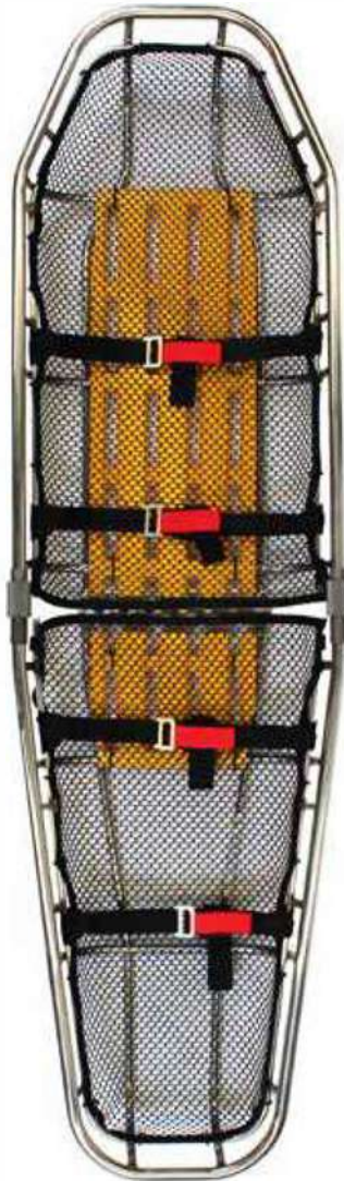
分體式錐形不銹鋼 分體式錐形鈦