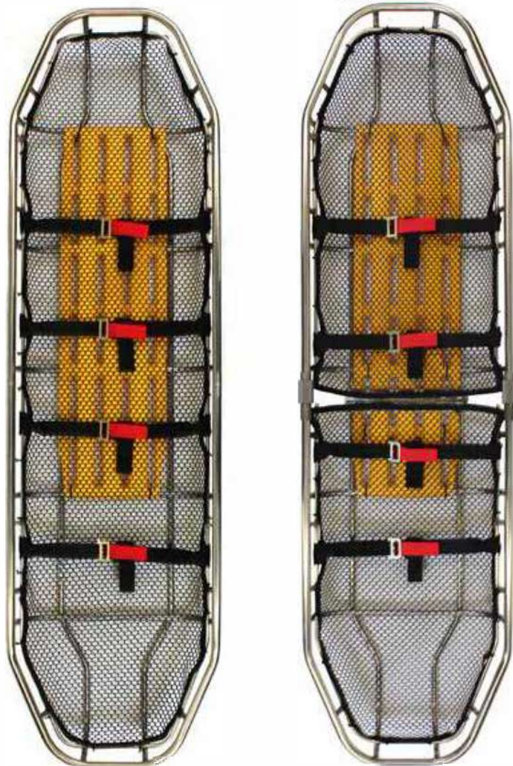
常規的不銹鋼 常規的鈦

獨特的功能包括一個 25.4 毫米（1 英寸）的頂管，相對於較小的管架，它更容易固定。四個 StratLoad™ 連接點使您可以快速、輕鬆、安全地將登山扣夾在您的擔架繩網上。這些連接點保護登山扣免受牆壁和岩石表面的影響。高密度聚乙烯 (HDPE) 網允許水和空氣輕鬆通過患者隔室，但小孔可防止雜物纏住。高密度聚乙烯 (HDPE) 材料不會生鏽，也不會對您的患者造成額外傷害。它們與減震繩相連，因此當負載放置不當時，它們會屈服。